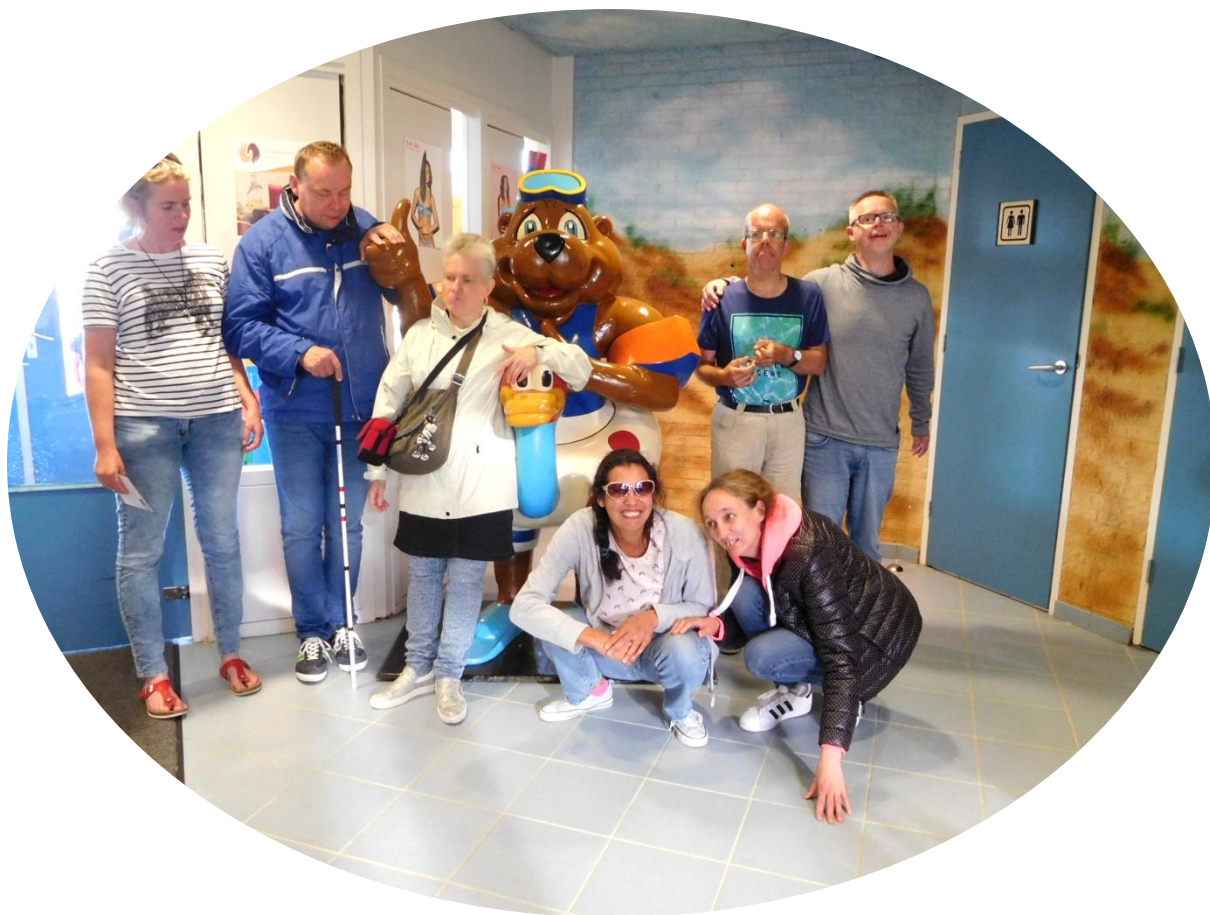
Bij de beer maken we een mooie groepsfoto.