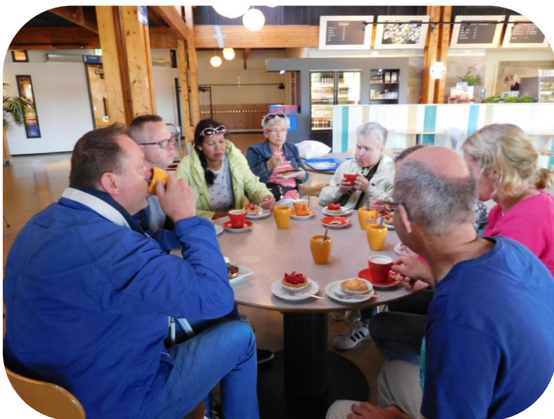
Een lekker bakkie drinken met een overheerlijk gebakje. Dat gaat er prima in.